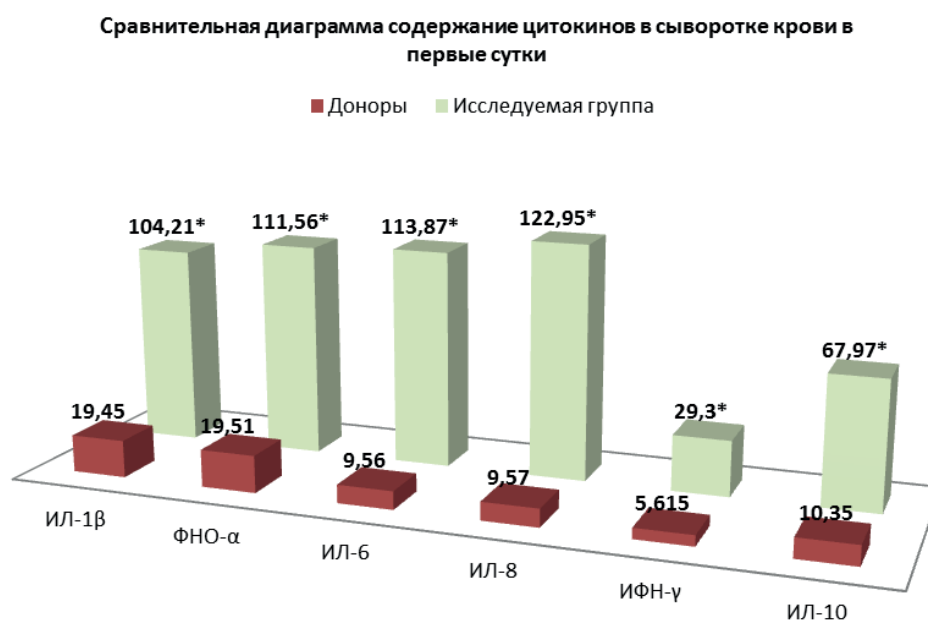
Рис. 1. Профиль цитокинов сыворотки крови у больных с ЧМТ в первые сутки после травмы.

Так, в частности, уровни ИЛ-1 \beta , ФНО- \alpha и ИЛ-10 превышали их сывороточные значения в среднем в 1,5 раза ( p < 0,05 ), ИЛ-6, ИЛ-8 и ИФН- \gamma – в 1,3 раза. Полученные данные логично согла-